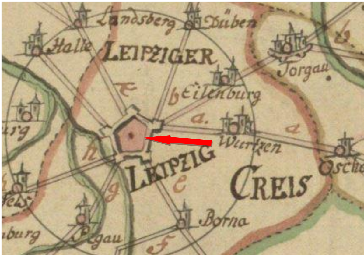
Bild: Stadtarchiv Leipzig (StadtA1), RRA (F) 282 Stapel. gemeinfrei