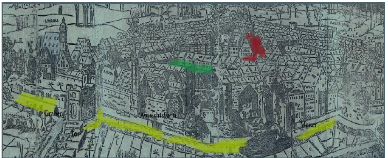
Bild: Stadtansicht Leipzig 1547

1. Färbe die Stadtmauer auf der Stadtansicht M 1 ein (gelb). Beschrifte die im Text genannten Bestandteile einer Stadtmauer auf der Stadtansicht (hier reicht es, wichtige Bestandteile einmal zu beschriften). (EA, 10 Min.)