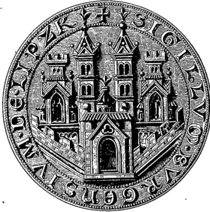
Aus dem Urkundenbuch der Stadt Leipzig: Codex Diplomaticus Saxoniam Regiam, Tafel I Siegel