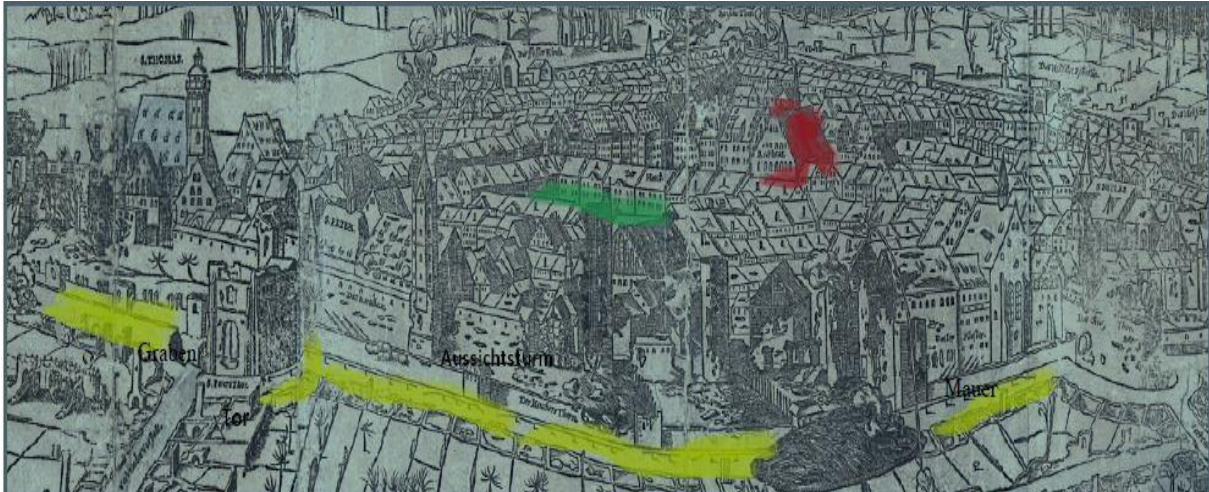
Bild: Stadtansicht Leipzig 1547

1. Suche das Rathaus auf deiner Stadtansicht M 1. Markiere es farbig (rot). (EA, 3 min.)