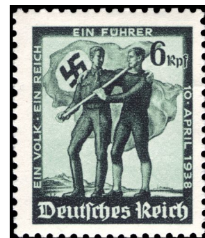
Q1: Briefmarke zur Volksabstimmung in Österreich, 8. April 1938