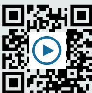
V1: Loom Tutorial https://t1p.de/ps4b

Es gibt zahlreiche Möglichkeiten für die Erstellung des Videos. Mit Loom könnt ihr eine Präsentation zeigen und parallel eine Tonspur aufnehmen. Mit einem Smartphone könnt ihr euch selbst oder ein Legevideo filmen. Unter den folgenden Links findet ihr Tutorials, die euch einige Möglichkeiten erklären.