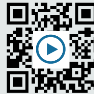
V3: Powerpoint-Präsentation in Video umwandeln https://t1p.de/q3kd