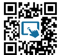
M6: Grundgesetz https://t1p.de/ygtj

④ In Artikel 1-4 des Grundgesetzes werden Menschen in Deutschland vor Ausgrenzung geschützt. Informiere dich mit Hilfe von M6 über deren Inhalt und erläutere diesen kurz.