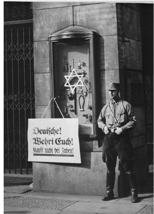
Q5: SA-Mitglied vor dem Warenhaus Tiet in Berlin (01.April 1933)