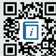
M5: Bildanalyse https://is.gd/NnNfyo

Hier findest du eine Wiederholung der Schritte der Bildanalyse und einige hilfreiche Formulierungen.