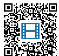
M1: Erklärvideo https://t1p.de/26c2

Beachte den Unterschied zwischen Ursachen und Anlass. Ursachen für den Krieg gibt es viele, aber nur einen Anlass.