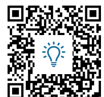
M2: Quiz https://t1p.de/r7pd

③ Teste dich! Überprüfe dein Wissen im Quiz M2. Du kannst deine Aufzeichnungen zu Hilfe nehmen.