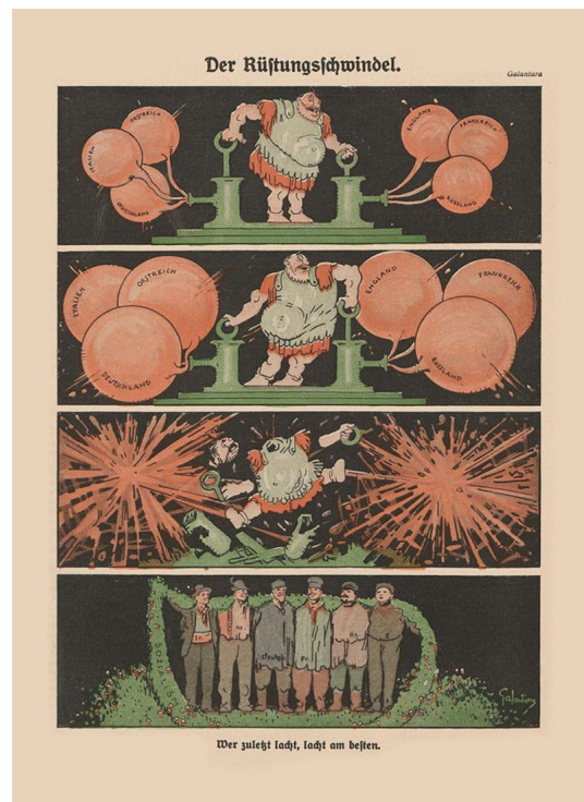
Q5: Karikatur Rüstungsschwandel in Der wahre Jacob 1913 von Gabriele Galantara, UB Heidelberg CC-BY-SA 4.0, https://t1p.de/3l2f