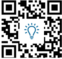
M1 Digitaler Zeitstrahl https://t1p.de/CarlHeine