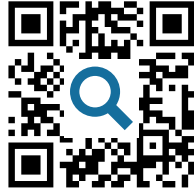
M2 Wikipedia-Artikel https://t1p.de/heinewiki