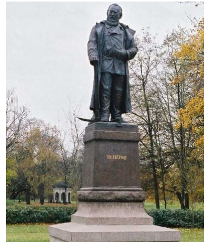
Q1 Carl-Heine-Denkmal in Leipzig

💡 M5: Hier geht's zum Denkmal https://t1p.de/heinedenkmal