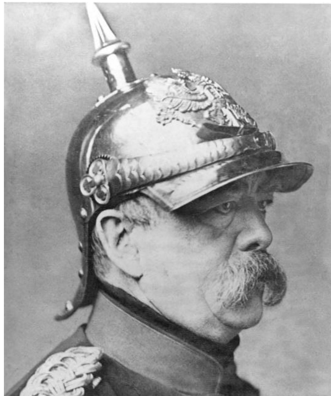
M1: Otto von Bismarck 1871