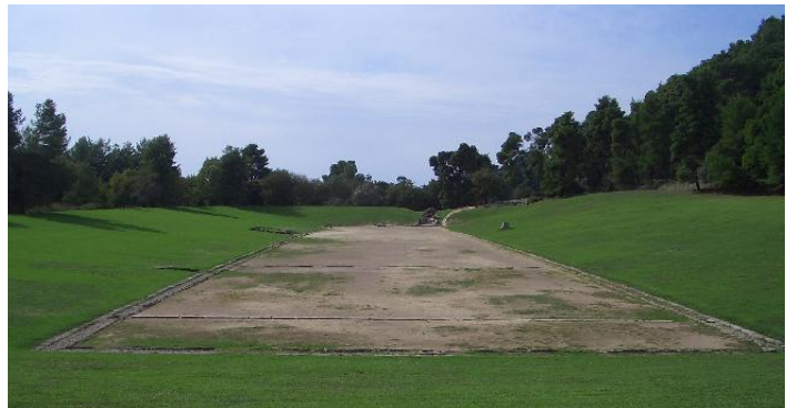
M1: ehemaliges Stadion von Olympia im Jahr 2004

Jede_r von euch hat sicher schon einmal von den Olympischen Spielen gehört. Das ist ein Sportereignis, an dem SportlerInnen aus der ganzen Welt teilnehmen und sich in verschiedenen Disziplinen messen. Die Olympischen Spiele haben eine sehr lange Geschichte. Ihre Wurzeln führen zurück in das antike Griechenland.